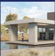
Photo page couverture : Maquette du futur centre de services de proximité de l'Est qui abritera la bibliothèque Marius-Barbeau